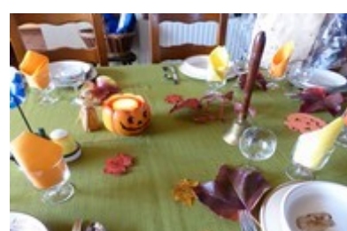
autre vue de la table décorée