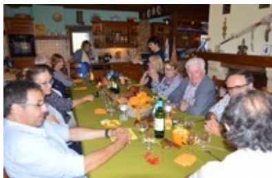
Ph MCV : vue générale