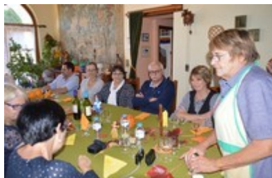
Jojo s'assure que tout va bien