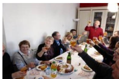
Nous trinquons à la nouvelle année