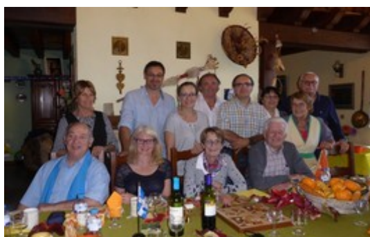
elle n'est pas sur la photo