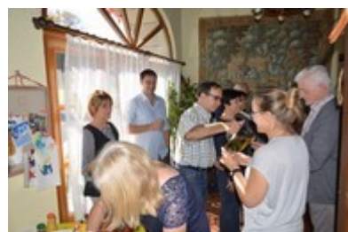
Ph Jojo : Service du Bec