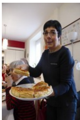
Ph Dominique : MCV au service