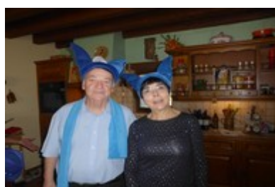
Les Roi et Reine