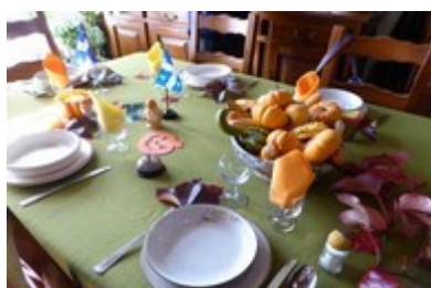
une vue de la table décorée