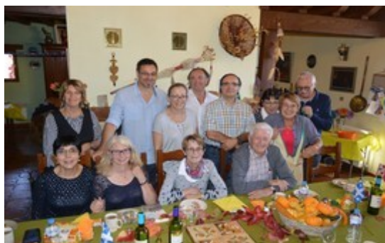
Ph Claude : il n'est pas sur la photo

Suivis de la projection de diapositives sur le Québec, présentées lors des portes ouvertes du CCSBM sur TV, et des traditionnelles photos de groupes :