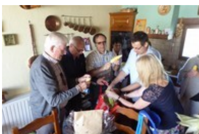
Mise à nu de l'épi