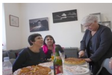
découpage de galette