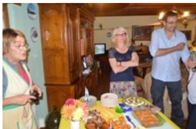
Ph Claude : des gourmands en attente ...