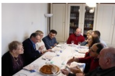
des gourmands en attente...