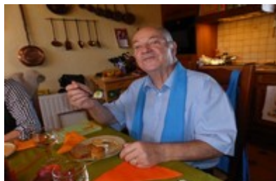
Un gourmand à table