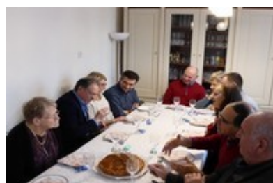
des gourmands en attente ...