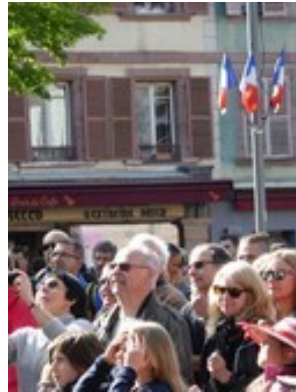
les supporters. BQ