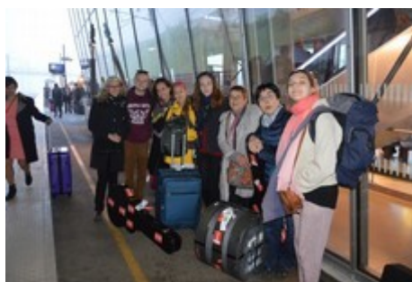
Ph. Cl. : avant les adieux...