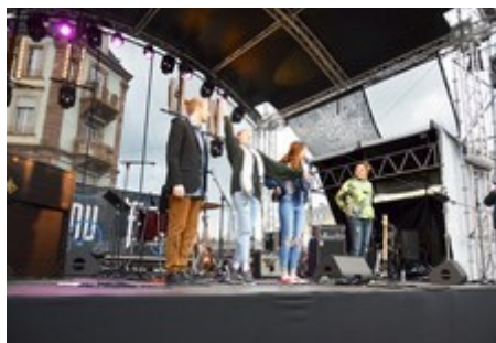
Ph. Cl. : Dernier salut... Le groupe au complet