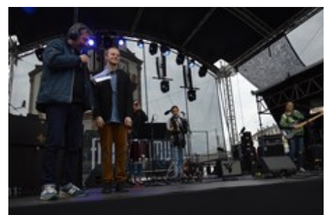
Ph. Cl. : à la radio « France-Bleu-Belfort »