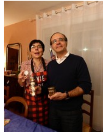
Ils en sont très contents