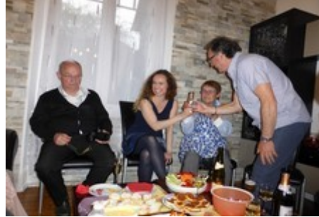
Ph. Cl. : Décontraction à l'apéritif