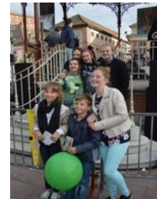
Ph. Cl. Il n'y a pas d'âge pour apprécier le concert