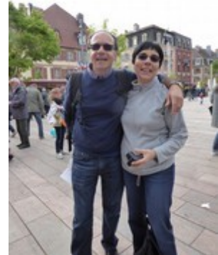
les supporters. BQ