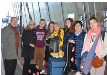
Ph. Cl. : avant les adieux...