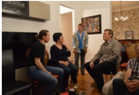
Ph. Cl. : Discussions animées