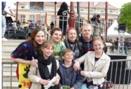
Belle photo !