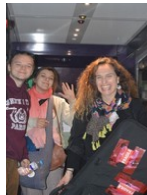
Ph. Cl. Ils sont à bord !