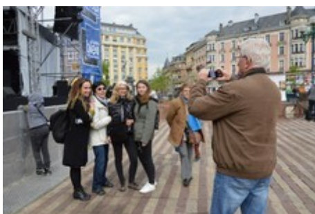
Ph. Cl. : Jacky immortalise le moment