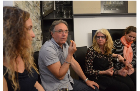
Ph. Cl. : Décontraction à l'apéritif