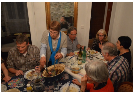
Ph. Cl. : plus on est de fous...