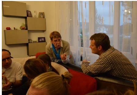
Ph. Cl. : Discussions animées