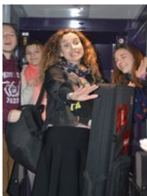
Ils sont à bord !