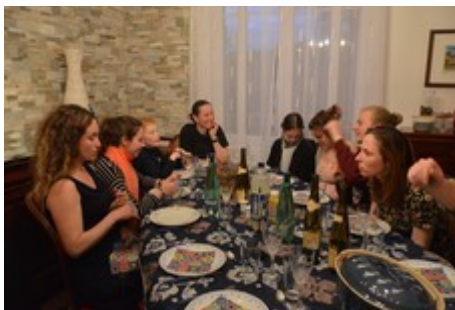
Ph. Cl. : Repas très animé