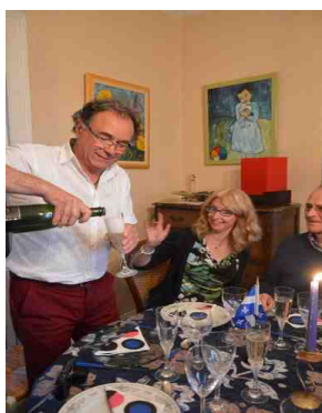
Hôtes souriants