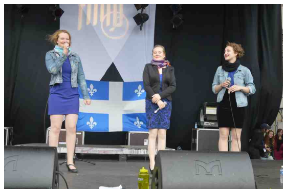
De Si Belles. scène Conservatoire