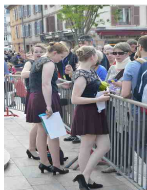
De Si Belles