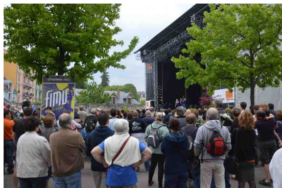
une foule attentive