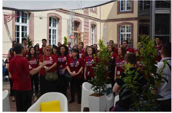
La délégation roumaine – extra !