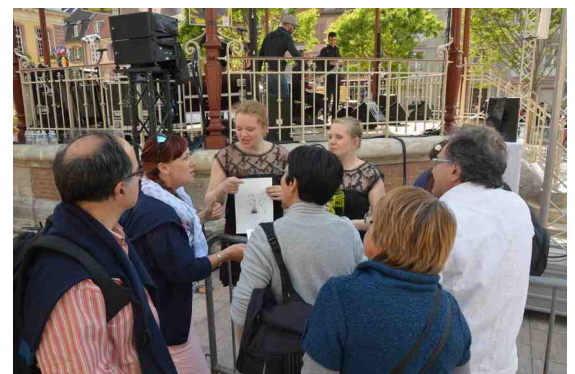
Félicitations d'après concert