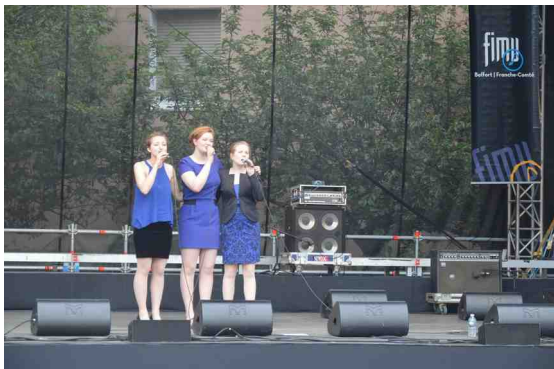
Ph. Jojo: De Si Belles scène Jazz