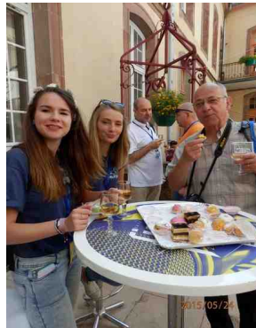
Ph. Jojo: dur-dur !