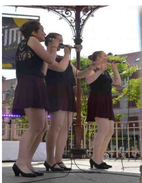
Ph. Claude : De Si Belles