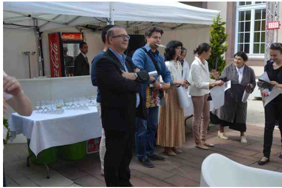
M Le Maire de Belfort et délégués