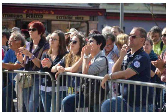
Membres de Belfort-Québec, admiratifs