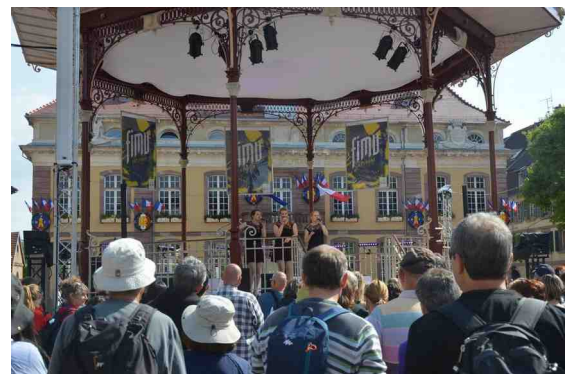
Foule et décors, hôtel de ville