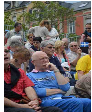
petit fleurdelysé