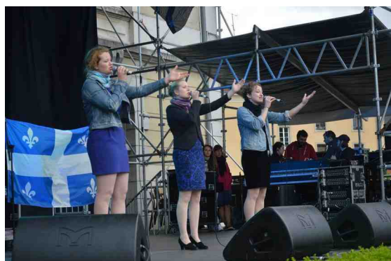
Ph. Joio: De Si Belles. ieu de scène