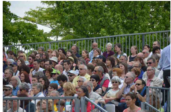
Les supporters de Belfort-Québec.