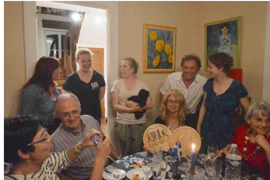
Ph. Claude: Remise des cadeaux et mini-concert