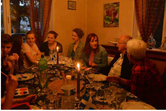
table coté artistes