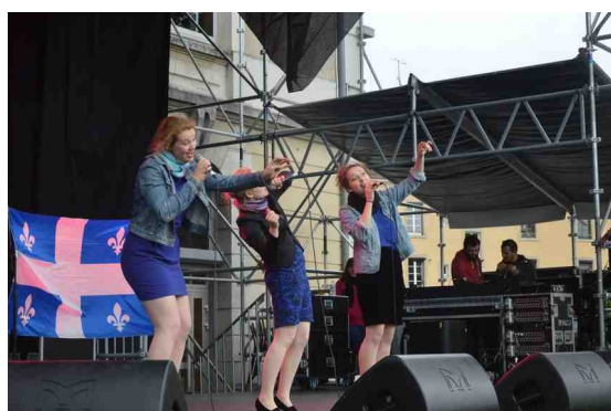
De Si Belles. autre ieu de scène