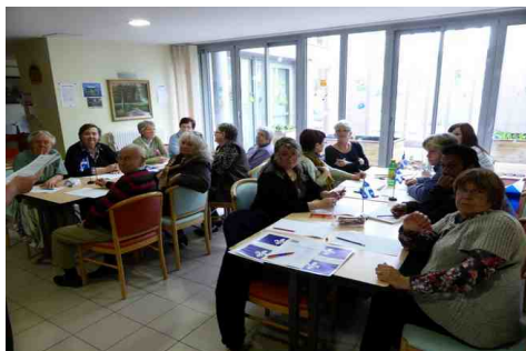
une vue générale.. ou presque ! Des participants