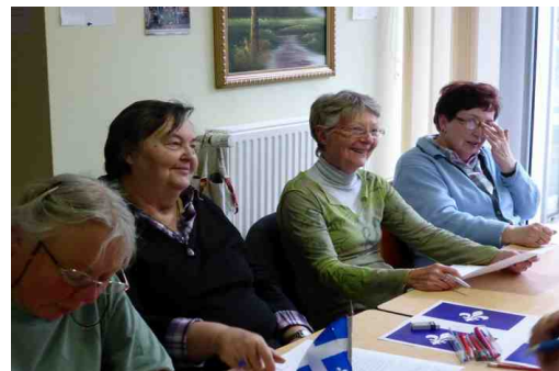
Relaxation après l'effort intellectuel