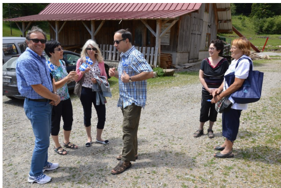
L'arrivée chez Mme Iltis (à droite à côté de Jojo)