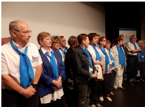
Les bénévoles sur la scène finale : ils ne sont pas tous là !