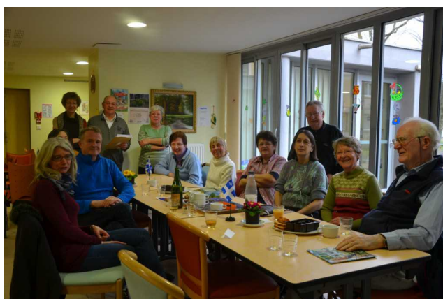
Les participants juste avant la lecture du palmarès