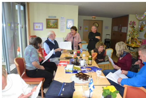
Les commentaires vont bon train APRES la lecture du palmarès