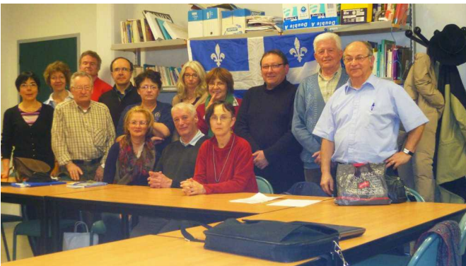
Les participants à l'AG du 7 mars 2013