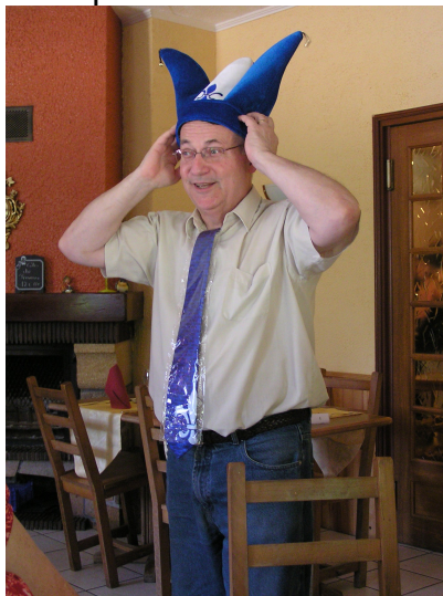
les gadgets en provenance directe du Québec à l'honneur

Le repas s'est tenu à Glay, au restaurant « La Papeterie » et le beau temps était de la partie.