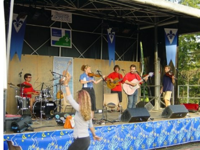
Le groupe « Chakidor » en action