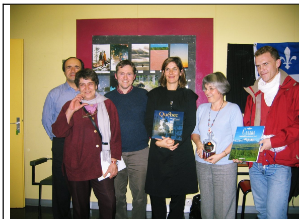
Les lauréats du « concours photos 2003 » avec le jury.