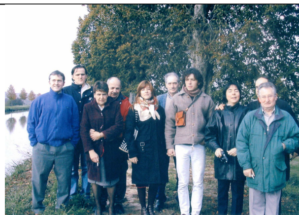
Les convives de la potironnade 2003 ».